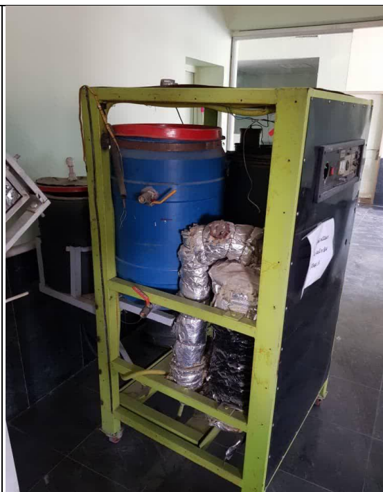
نمونه آزمایشگاهی سامانه نیروگاه تولید همزمان برق و حرارت کوچک مقیاس (پژوهشکده انرژی های تجدید پذیر دانشگاه تربیت مدرس)