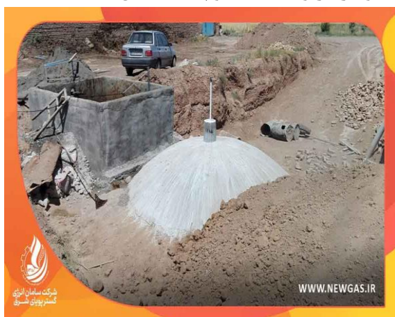
پروژه هاضم مستقر در روستای خوجان نیشابور توسط شرکت پیشنهاددهنده بهره‌بردار

وجه تمایز اصلی بین فناوری‌های بین‌المللی و محصول موجود، بومی‌سازی سامانه یکپارچه هاضم-مولد در ابعاد کوچک به منظور راه‌اندازی یک دیزل ژنراتور ۵۰ کیلووات است. همچنین وجه تمایز با محصول داخلی، استفاده از فناوری‌های کنترل دقیق در رصد میزان تولید بیوگاز در واحدهای کوچک مقیاس است.