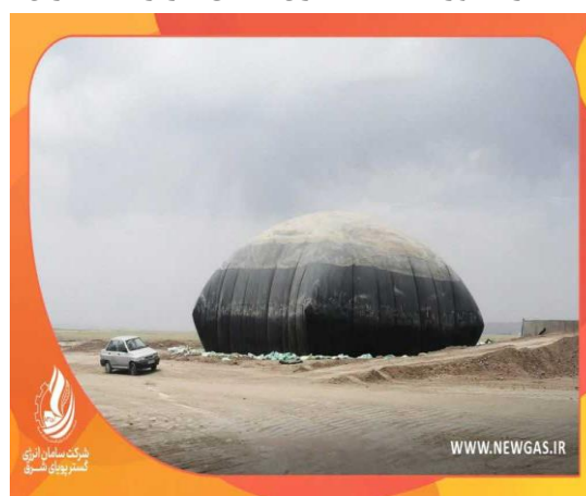
پروژه ۱۵۰۰ مترمکعبی ذخیره‌سازی بیوگاز توسط شرکت پیشنهاددهنده بهره‌بردار