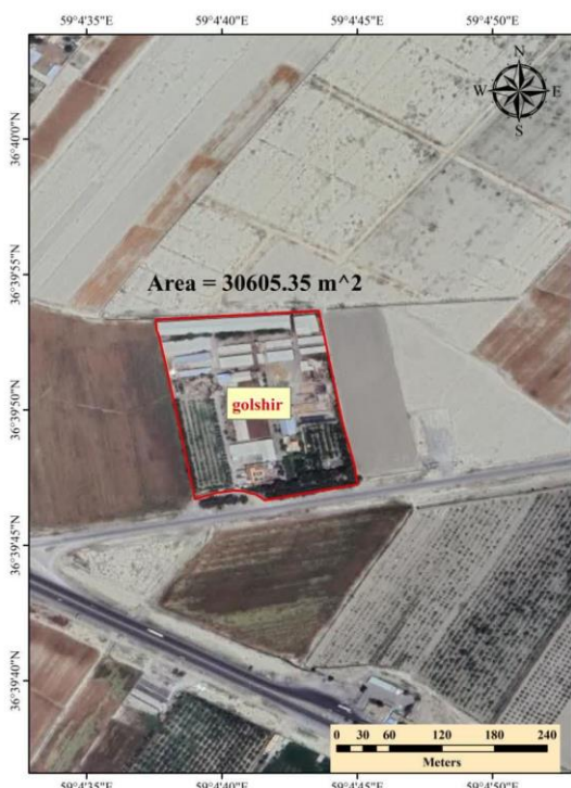
محل جغرافیایی دامداری